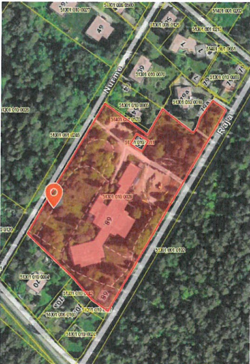
Joonis 1. Nurme tn 68 detailplaneeringu ala.

1.4 Keskkonnamõju strateegiline hindamine jäetakse algatamata.